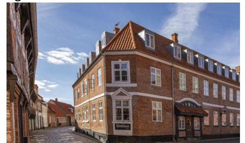
"Klubben" hotel og loge 2021