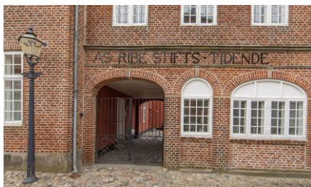
Ribe Stifts-Tidendes bygning fra 1919